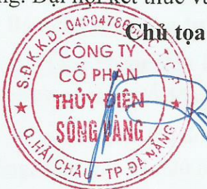
Lê Thái Hưng

Biên bản họp Đại hội đồng Cổ đông của CTCP Thủy điện Sông Vàng gồm 05 trang. Đại hội kết thúc vào lúc 11 giờ 00 phút cùng ngày./.